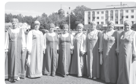
На фото: ансамбль народной песни «Раздолье»

Порадовала чудесная погода, как будто на юге побывали. В общем - поездка удалась. Коллектив народной песни «Раздолье»