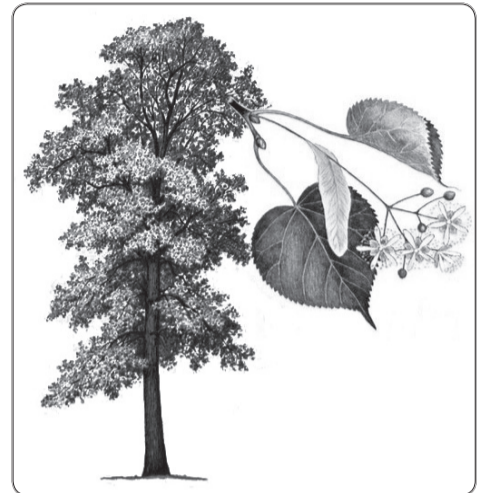
На рис.: общий вид дерева и липовый цвет.

В старину древесина липы пользовалась колоссальным спросом на Руси, поскольку служила главным материалом для изготовления всевозможной домашней утвари и прочих токарных изделий: миски, ложки, скалки, веретена, сапожные колодки, гармошки,