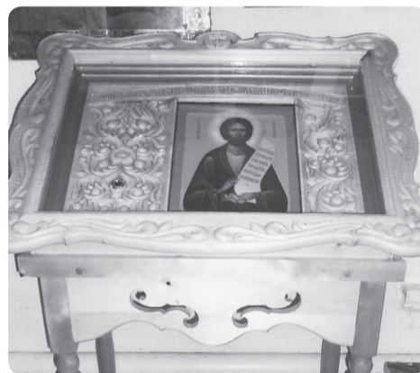
На фото: Икона святого Симеона Верхотурского

Только почему-то в Пашии быть христианином не престижно. Стыдно прийти в наш храм. Обычно называются причины: «нет времени», «что скажут люди?», «засмеют на работе», «не мужское это дело» (хотя в православной