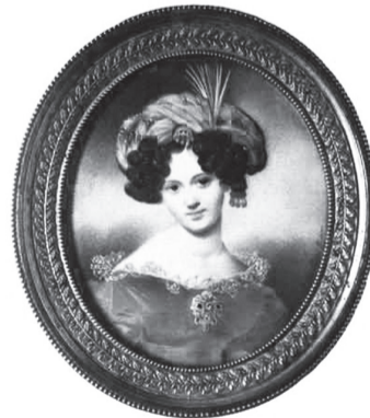
На фото: портрет В.П. Шуваловой-Полье работы П.О. Росси (1789–1831)

первой итальянской супруги княгини Бутеро из города Палермо он унаследовал титул, фамилию и завидное положение в сицилийском обществе. Вероятно, новый роман побудил Вильдинга искать повод переселиться в Россию. На исходе 1835г. новый кандидат в мужья отправился в Петербург чрезвычайным посланником Королевства Обеих Сицилий. Этот поступок устранил последние сомнения обворожительной вдовы. В начале следующего 1836г. она стала княгиней ди Бутера-Радоли. В отечественных архивах, в первичных документальных источниках, фамилия княгини почти повсеместно пишется Бутера-Радали.