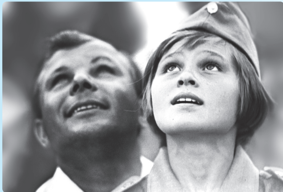
На фото: Он снова зовет нас вывись!