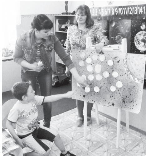
На фото: Мастер-класс «мыльной астрономии»