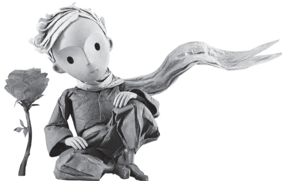
На фото: Маленький принц и Роза (из мультфильма)

Теперь, когда вытаскивает мусор, они самостоятельно определяют начало рабочего дня. На улицах столько мусора, что невольно думается: а не специально ли гадили? Увы, иногда специально. Что это значит?